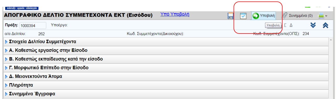
Εικόνα 4 Υποβολή Δελτίου «Εισόδου» (1)